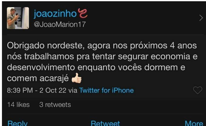
Figura 02 - Comentário xenófobo de um usuário do Twitter

Conclui-se então que sempre ficou muito claro quais eram os objetivos de Jair Messias Bolsonaro em seu governo perante as questões indígenas e ambientais. Seus pensamentos eram carregados pela herança histórica de invisibilização e exploração de grupos afetados pela ação dos colonizadores no país.